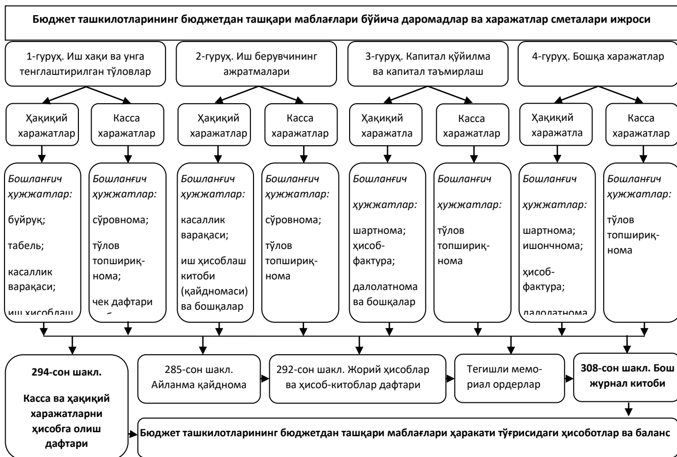
5-расм. Бюджет ташкилотларининг бюджетдан ташқари маблағлари бўйича харажатларини ҳужжатлаштириш ва ҳисобини юритишнинг схематик кўриниши 1

Бюджет ташкилотининг бюджетдан ташқари маблағларининг шаклланиш манбалари ва уларни сарфланиш йўналишлари бир-биридан тубдан фарқ қилади. Аммо, ушбу маблағлар бўйича харажатлар, уларни амалга ошириш, ҳисобини юритиш билан боғлиқ умумий жиҳатлари мавжуд. Яъни, барча бюджетдан ташқари маблағларнинг сарфланиши харажатларнинг иқтисодий таснифга асосан тўртта гуруҳ (иш хақи ва унга тенглаштирилган тўловлар, иш берувчининг ажратмалари, капитал қўйилмалар ва капитал таъмирлаш, бошқа харажатлар) асосида амалга оширилади (5-расм).