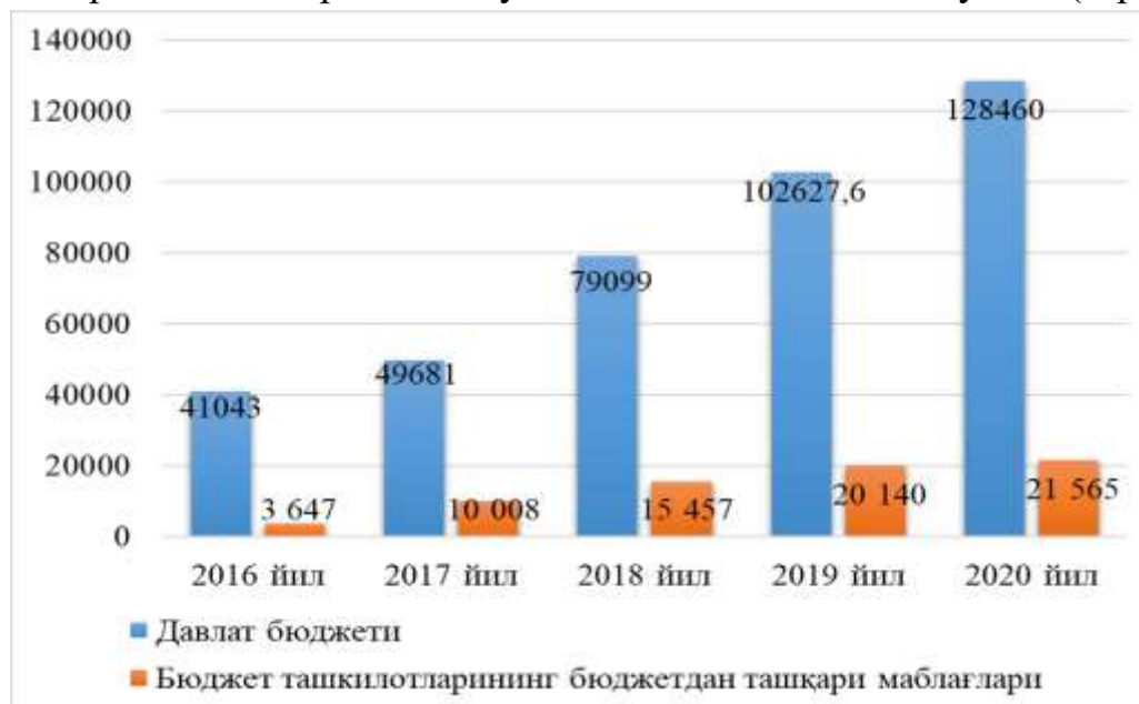
2-расм. Бюджет ташкилотларини бюджетдан ташқари молиялаштириш ҳажмининг ўзгариш динамикаси (млрд. сўм) 3

Давлат таълим ва тиббиёт ташкилотларини молиялаштириш Давлат бюджети харажатларининг энг муҳим йўналишларидан саналиб, 2021 йил 1 январь ҳолатига улар мамлакатда фаолият кўрсатаётган ташкилотларнинг 66,8 фоизини ташкил қилиб, ушбу соҳаларга йўналтирилаётган маблағлар давлат бюджетининг 52,1 фоизига тўғри келмоқда. 2 2016-2020 йиллар давомида республика миқёсида бюджет ташкилотларининг бюджетдан ташқари молиялаштириш манбалари ҳажми ўсиш тенденциясига эга бўлган (2-расм).