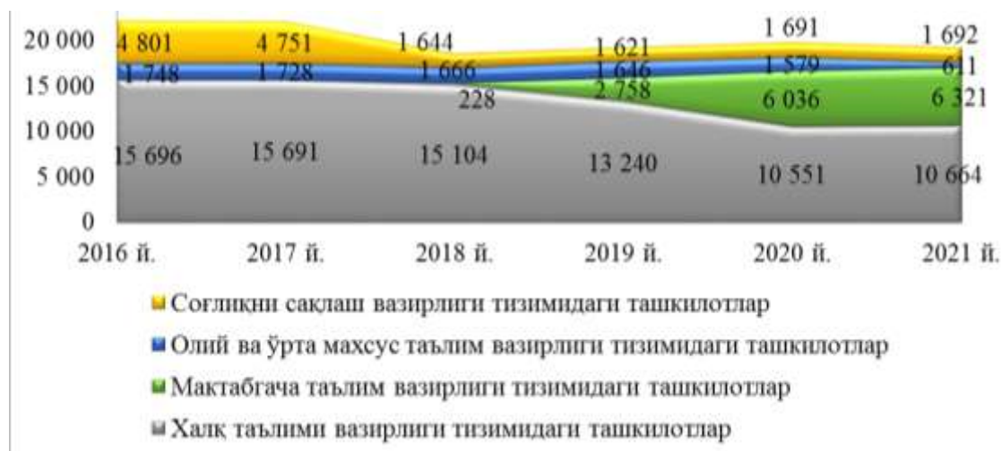
1-расм. Давлат таълим ва тиббиёт ташкилотлари сонининг даврий ўзгариши (1 январь ҳолатига) 1

Давлат таълим ва тиббиёт ташкилотларини молиялаштириш Давлат бюджети харажатларининг энг муҳим йўналишларидан саналиб, 2021 йил 1 январь ҳолатига улар мамлакатда фаолият кўрсатаётган ташкилотларнинг 66,8 фоизини ташкил қилиб, ушбу соҳаларга йўналтирилаётган маблағлар давлат бюджетининг 52,1 фоизига тўғри келмоқда. 2 2016-2020 йиллар давомида республика миқёсида бюджет ташкилотларининг бюджетдан ташқари молиялаштириш манбалари ҳажми ўсиш тенденциясига эга бўлган (2-расм).